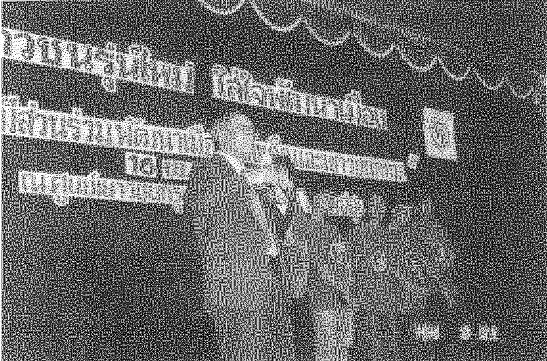
รูปที่ 2 ส่งเสริมการมีส่วนร่วมในการพัฒนาเมืองของเยาวชนในกรุงเทพมหานคร

ขอบพระคุณ ท่านบรรณาธิการที่กรุณาแนะนำ ให้ไปสัมภาษณ์บุคคลต่าง ๆ และให้โอกาสนำบท สัมภาษณ์มาลงพิมพ์ในวารสารของสถาบันฯ ซึ่งเรื่องนี้ ก็จะเป็นบทสัมภาษณ์เรื่องสุดท้ายของผู้เขียน เนื่องจากมี