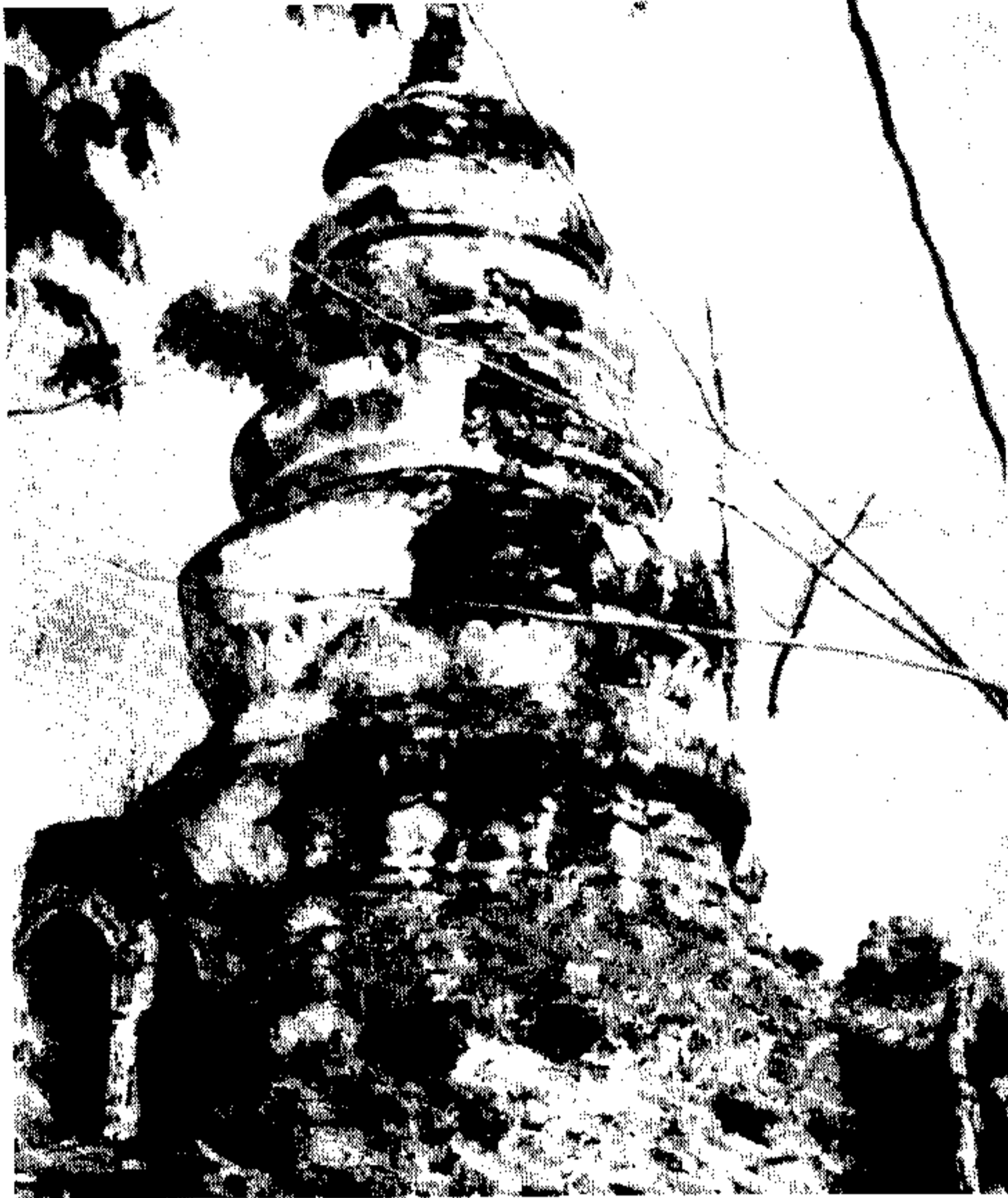
รูปที่ 3 พระธาตุดอยเล็งองค์เดิมก่อนบูรณะในปี พ.ศ. 2540

ตามที่เล่าสู่กันฟังมานี้ หากบรรดาสมาชิก ท่านใดแวะเวียนผ่านไปจังหวัดแพร่ ใครเชิญชวนขึ้นไป นมัสการพระธาตุดอยเล็งและช่วยกันทำบุญบูรณะพระ