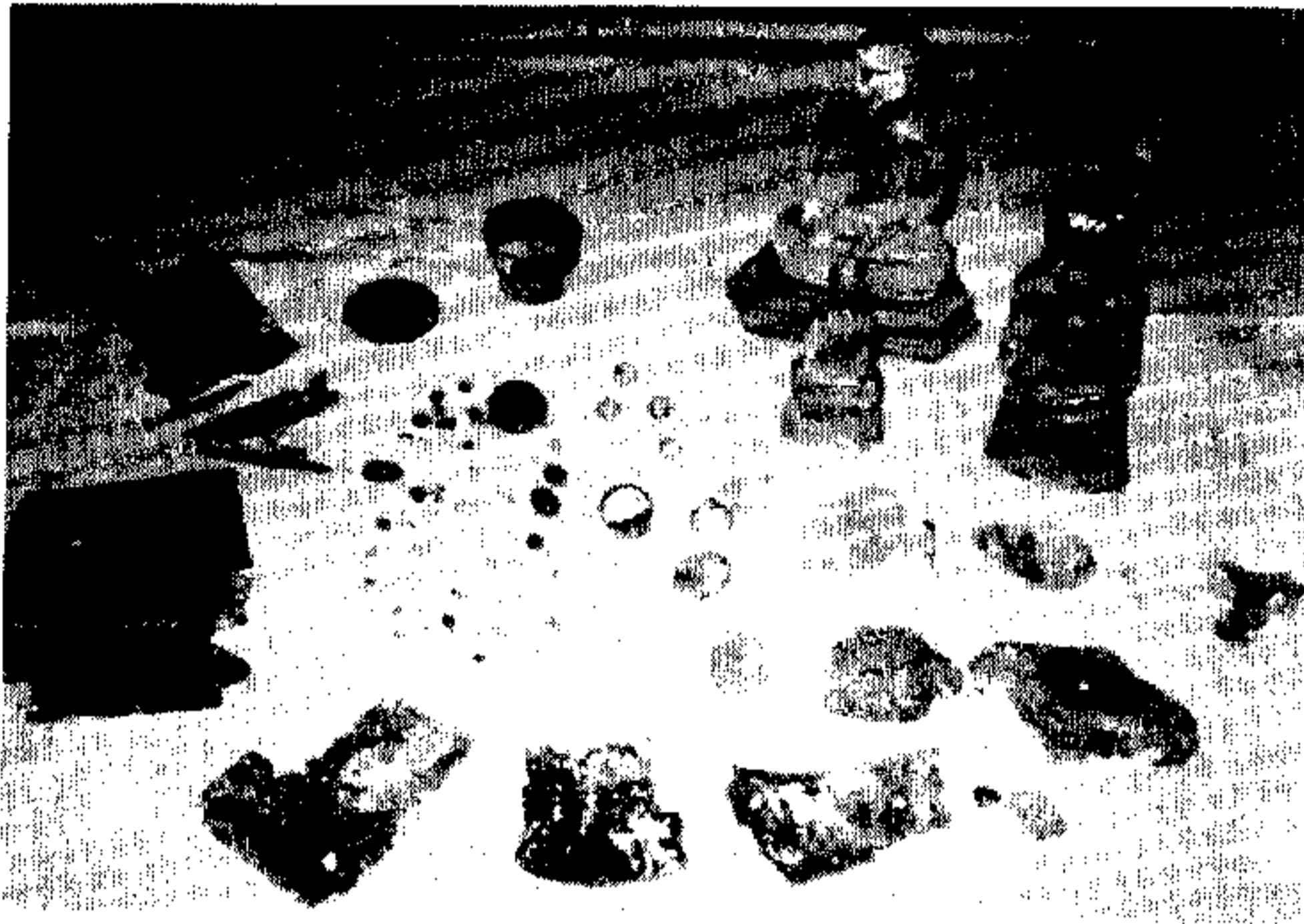
รูปที่ 2 ของมีค่าที่ขุดพบ ณ พระธาตุดอยเล็ง เมื่อ พ.ศ. 2540

ในปี พ.ศ. 2540 คณะสงฆ์โดยการนำของ หลวงปู่ท่านเจ้าคุณพระธรรมรัตนาร รองเจ้าคณะภาค 6 ฝ่ายสงฆ์ ตลอดจนฝ่ายฆราวาสนับแต่ผู้ว่าราชการ จังหวัดแพร่ ข้าราชการอื่น ๆ พ่อค้า และประชาชน ได้ ร่วมกันบูรณะองค์พระธาตุที่เอียงให้กลับตั้งตรง โดยมี พระมหาวชิรุต เป็นแกนนำในการดำเนินการบูรณะ ได้ มีการทำถนนขึ้นพระธาตุดอยเล็งซึ่งปกติเป็นดอย ค่อนข้างสูงชันจนสามารถนำรถยนต์ขึ้นไปได้ ทั้งนี้โดย ความช่วยเหลือของเจ้าหน้าที่ป่าไม้ รวมทั้งได้มีญาติ ธรรมทั้งในท้องถิ่นและจากกรุงเทพฯ ขึ้นไปร่วมบูรณะ ถังน้ำ สร้างศาลาพำนักสงฆ์ ศาลาปฏิบัติสังฆกิจ และ ห้องน้ำ จนอยู่ในสภาพเหมาะสมสมควรแก่สภาพ ในปัจจุบัน