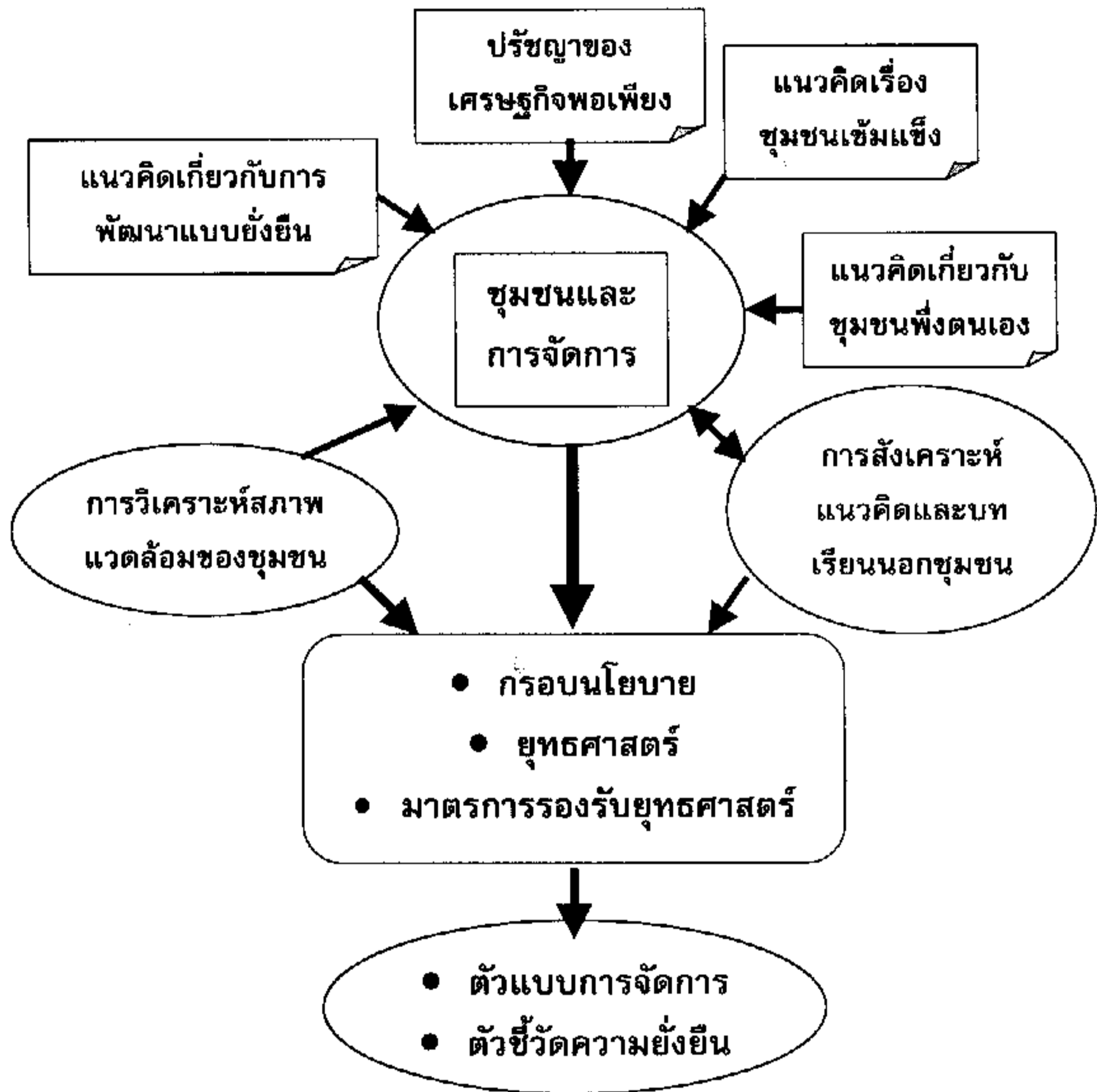
แผนภาพที่ 2: กรอบแนวคิดในการศึกษา